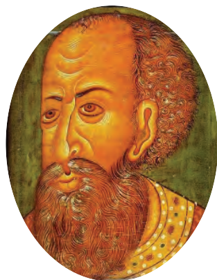
Царь Иван IV Грозный