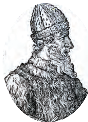
Великий князь Иван III

До XVIII века чиновники на Руси жили благодаря так называемым «кормлениям», то есть, при отсутствии оклада за исправление должности, разрешению на подношения от заинтересованных в их деятельности лиц. Одаривали их не только деньгами, но и «натурой» — мясом, рыбой, пирогами и пр., что было делом обыкновенным.