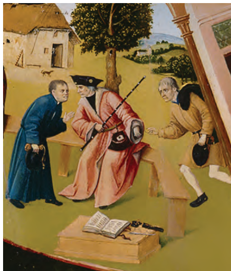
Фрагмент «Алчность» картины Иеронима Босха «Семь смертных грехов»

Рассматривая участников коррупции на примере взяточничества, стоит отметить, что в коррупционном процессе всегда участвуют две стороны. Одна сторона — это взяткополучатель (подкупаемый). Вторая сторона — это взяткодатель (осуществляющий подкуп). Также в процессе может участвовать и третья сторона — посредник.