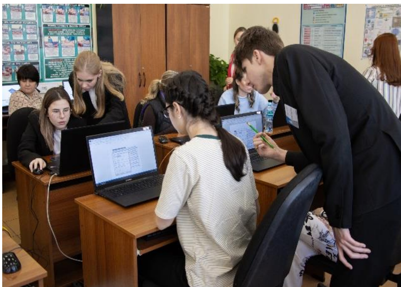
Мастер-класс для абитуриентов сопровождают студенты-волонтёры