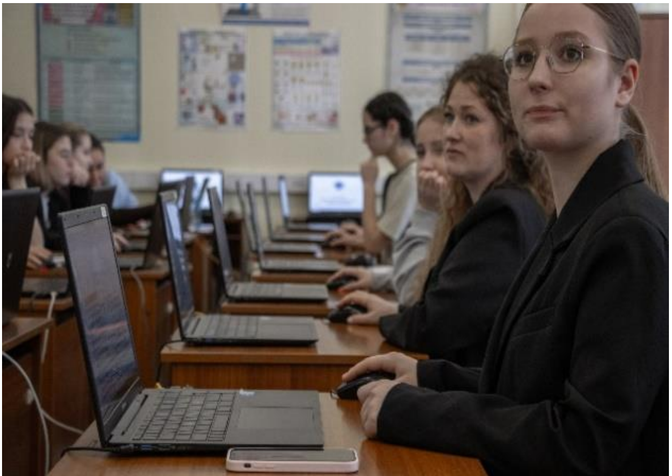
Абитуриенты в процессе проведения мастер-класса