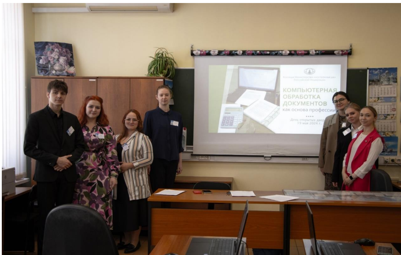
Преподаватели и студенты-волонтёры