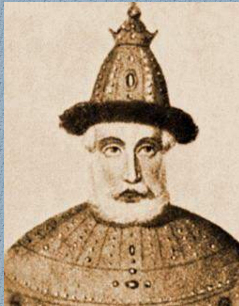
Василий III Иванович.