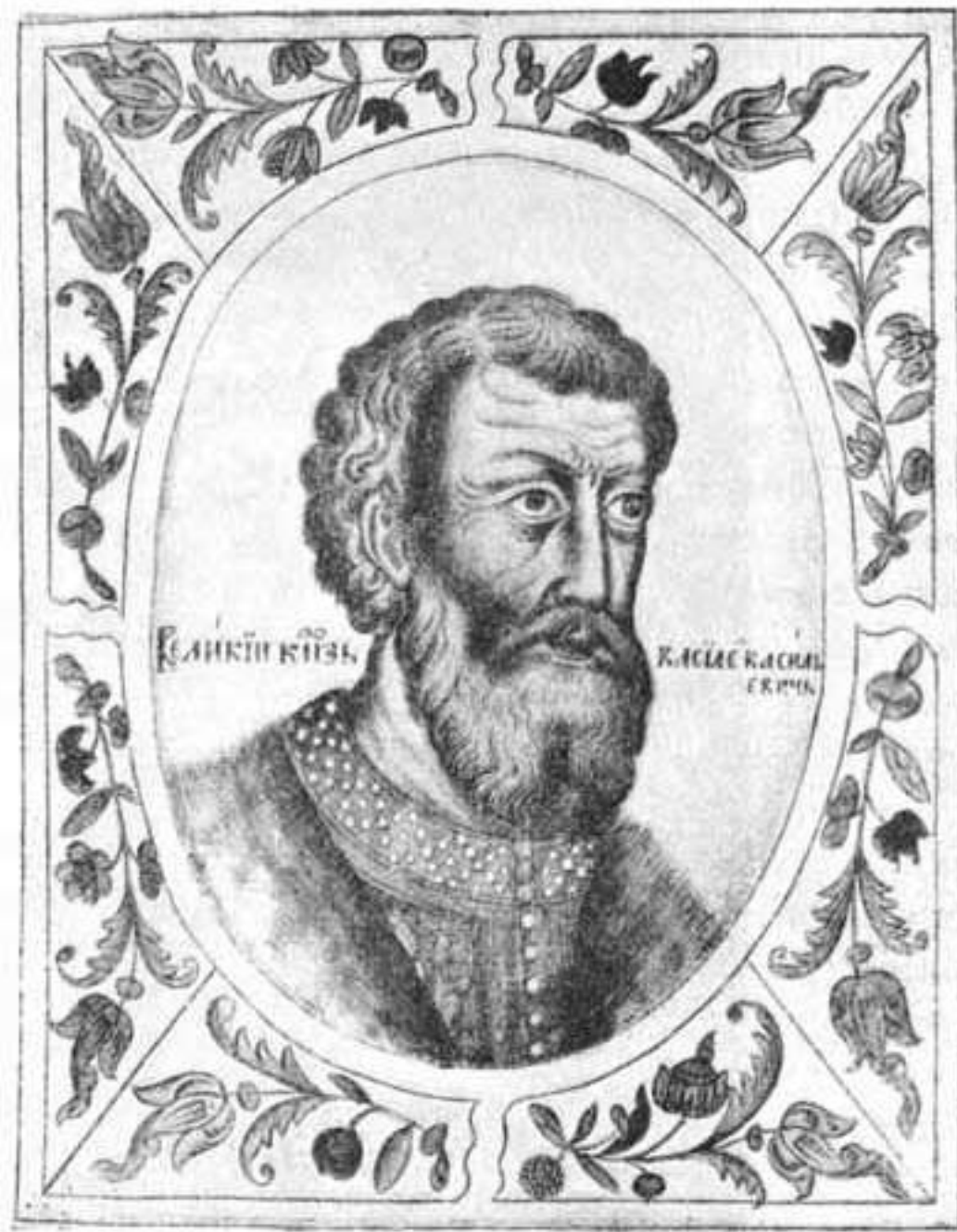
Московский великий князь Василий II Тёмный.

В 16-летнем возрасте его отец, великий князь Московский Василий II, прозванный из-за слепоты Тёмным, назначил Ивана своим соправителем; в 22-летнем возрасте Иван занял престол после смерти отца.